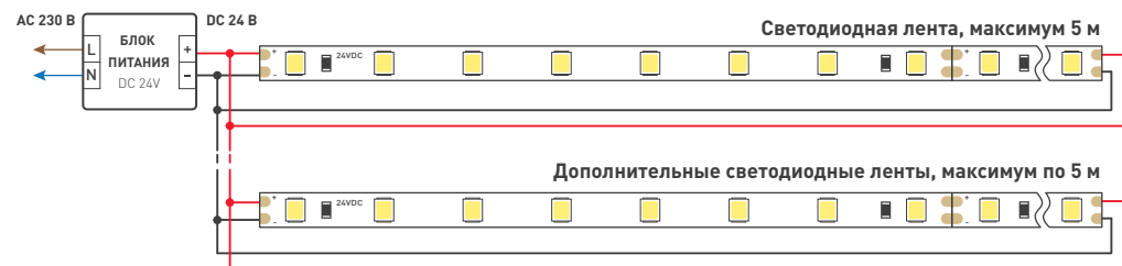
Схема 1. Подключение нескольких светодиодных лент с двух сторон