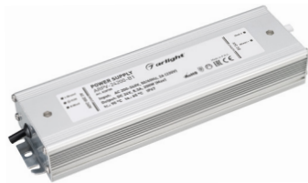
ARPV-12200-B1 ARPV-24200-B1 ARPV-24300-B1